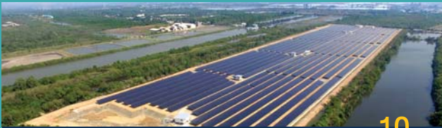
นาโคก, สมุทรสาคร