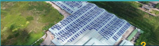
บริษัท เลคิซ ไลต์ติ้ง จำกัด, สมุทรสาคร