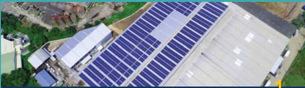
บริษัท ลีไฟเบอร์บอร์ด จำกัด, สมุทรสาคร