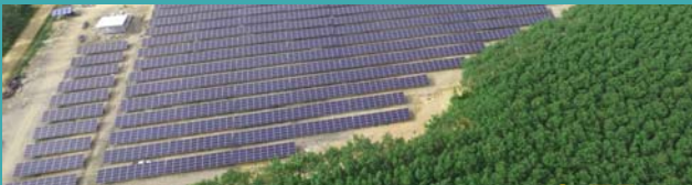
ทุ่งสง, นครศรีธรรมราช